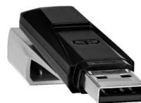
Modelo de mídia criptográfica do tipo USB

O cartão inteligente necessita de uma leitora, que pode ser ligada diretamente via USB ao computador para realizar a gravação ou utilização do certificado digital, precisa de instalação de softwares adicionais e não depende de acesso à internet para gerar assinatura digital. A Escola de Especialistas da Aeronáutica por meio do Pregão Eletrônico Nº 00010/2023 (SRP) licitou Leitora Cartão / Peças E Acessórios Tipo: Externa Para Cartões Smart Card , Conectividade: Usb Mínimo 1.1 , Taxa Transferência: Mínima 12mb/S Em Usb 1.1 E 480mb/S Em Usb 2.0 licitou o produto a um valor de R$ 68,80 a unidade.