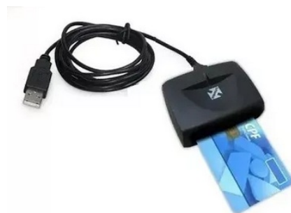
Modelo de cartão mais leitora

Em relação às mídias criptográficas, para o armazenamento de certificado digital estão disponíveis no mercado 2 opções: cartão inteligente e token USB.