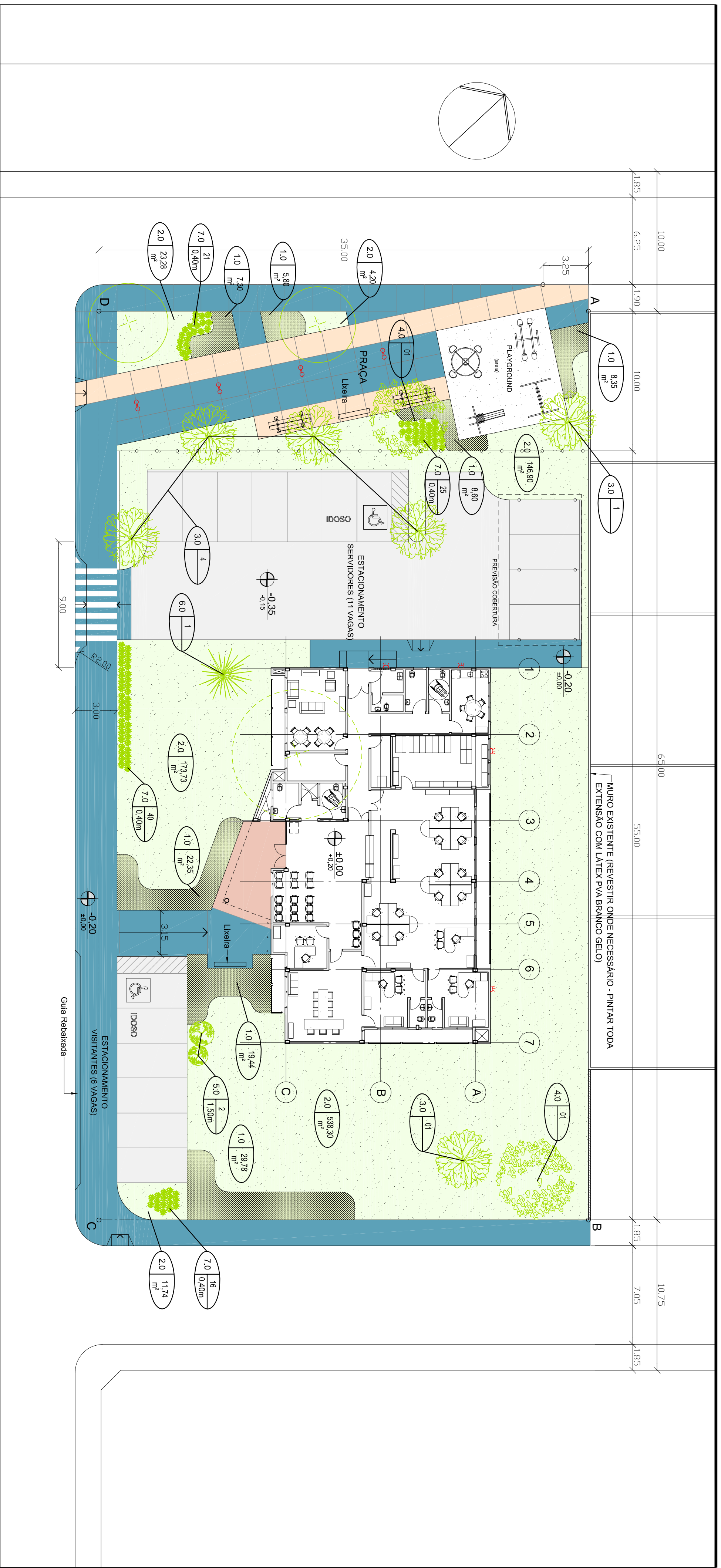
TABELA DE PLANTIO