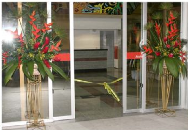
MODELO DE ARRANJOS EM COLUNA