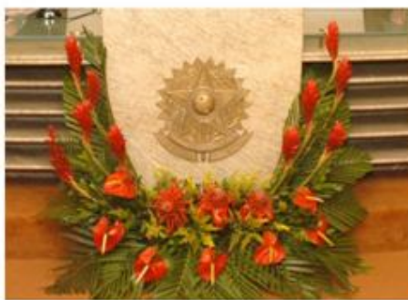
MODELO DE ARRANJO BASE MESA AUDITÓRIO