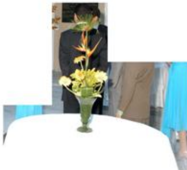
MODELO DE ARRANJO PARA MESA DE APOIO