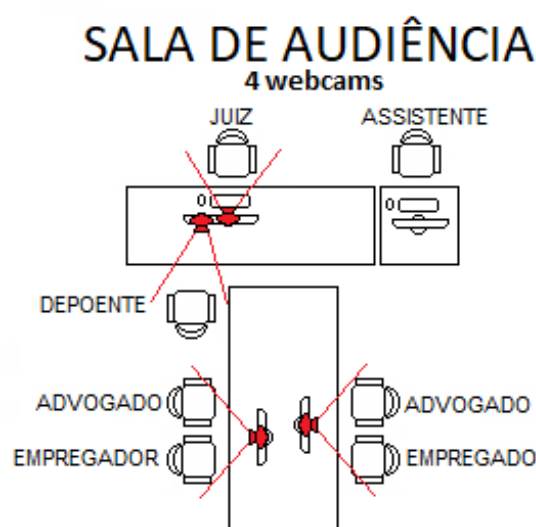
Figura 1 - Esquema de funcionamento da sala de audiências com webcams

Essa forma de operação também favorece maus contatos, que podem prejudicar a dinâmica da audiência, devido ao conjunto de fios e extensores conectados em um mesmo PC, já o funcionamento é retratado na Figura 1, abaixo.