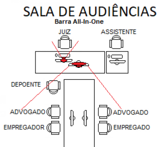
Figura 2 - Esquema de funcionamento da sala de audiências com barra de vídeo USB.

É uma solução mais robusta quando comparada à SOLUÇÃO 2 em virtude de os componentes serem integrados facilitando a operação, diminuindo o risco de mau contato e a quantidade de fios e extensores.