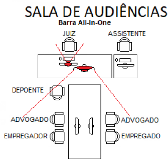
Figura 3 - Esquema de funcionamento da sala de audiências com barra all-in-one com software de videoconferência integrado

Como evidenciado pela figura 3, a dinâmica deste cenário permite captar visão panorâmica dos advogados e depoentes, posto que a barra tipo all-in-one fica em posição mais afastada dos atores.