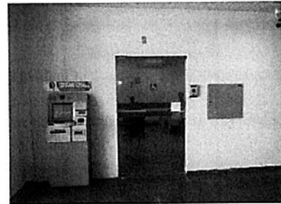
Posto da CEF