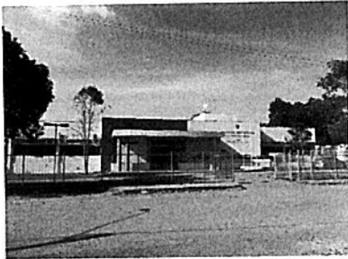
Fachada do Fórum

de Imperatriz), porque construído, inicialmente, para sediar apenas uma, estando a Secretaria da 2ª Vara instalada em uma sala distante do local onde se realizam as audiências e dos gabinetes dos juízes.