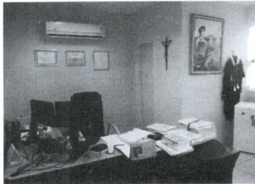
Gabinete da Juíza Titular