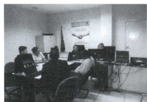
Sala de Audiência