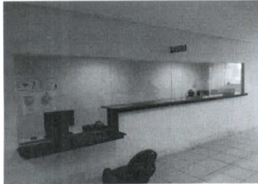
Balcão de Atendimento