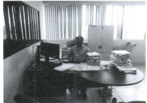
Mesa do Diretor