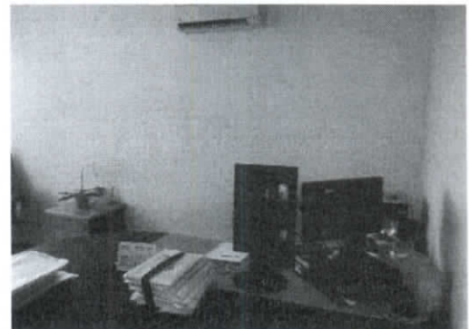
Gabinete da Juíza Substituta