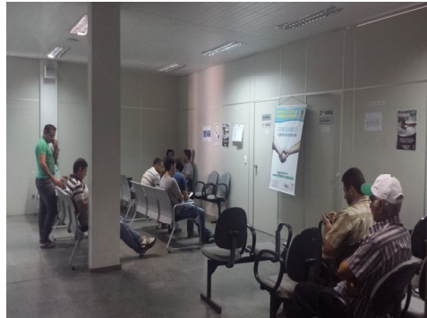
Sala de Espera para Audiências