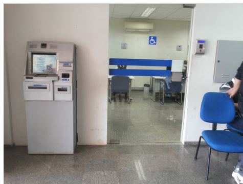
Posto da Caixa Econômica Federal