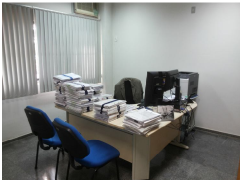
Gabinete do Diretor do Foro