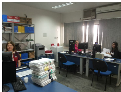
Sala da Seção de Distribuição