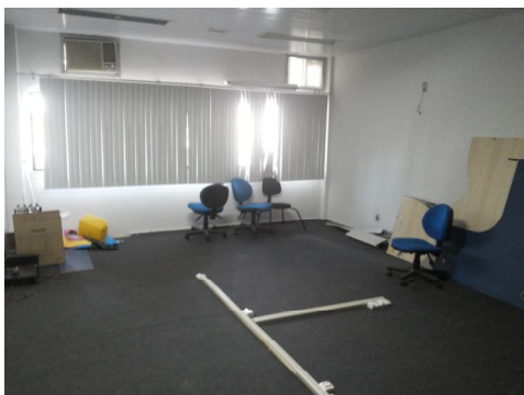
Sala reservada para instalação de Auditório*