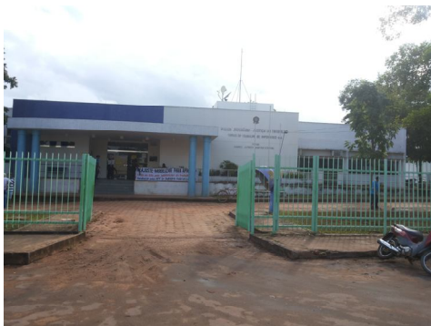
Fachada do Foro Manoel Alfredo Martins e Rocha

À exceção das instalações físicas da 1ª e da 2ª Vara do Trabalho de Imperatriz, individualmente examinadas nas Atas de Correição respectivas, verificou-se que as áreas comuns do Foro Manoel Alfredo Martins e Rocha se encontram compatíveis com os trabalhos aqui desempenhados, em bom estado de conservação, conforme fotografias abaixo.