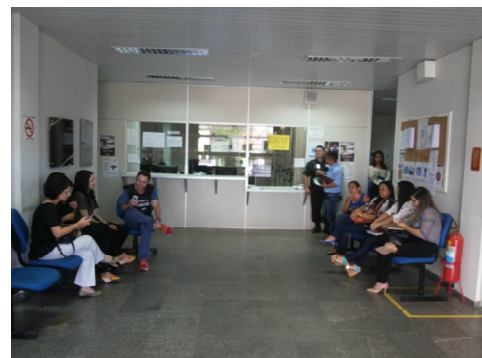
Hall de Entrada