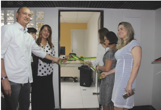
Inauguração do Setor Gráfico