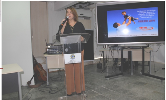
Inauguração da Seção de Cerimonial