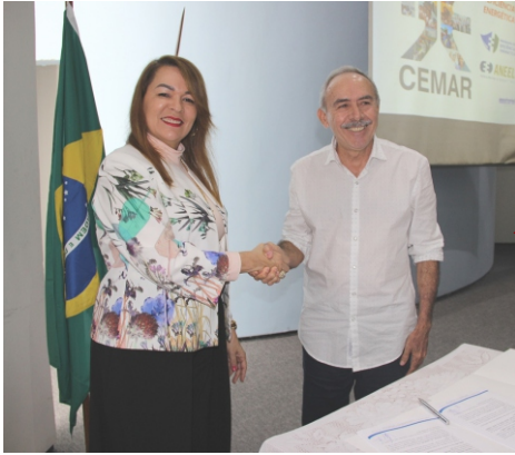
Assinatura do Termo de Cooperação TRT16 e CEMAR