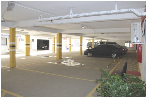
Limpeza e sinalização da garagem oficial