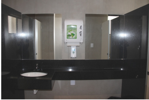
Reforma dos banheiros do prédio-sede