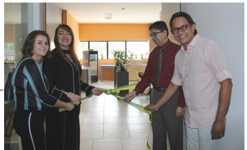
Inauguração das novas instalações do restaurante do Fórum Astolfo Serra