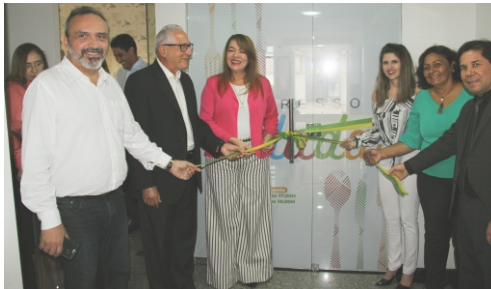
Inauguração das novas instalações do restaurante do prédio-sede do TRT 16