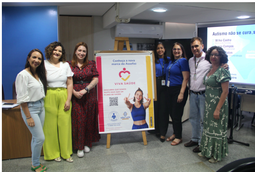
Imagem da roda de conversa “Autismo não se cura, se compreende: um guia básico para identificar, entender e agir”

(A imagem mostra um grupo de pessoas, sendo seis mulheres e um homem, em um evento em uma sala de conferências. O grupo está em frente a um painel de divulgação da Fundação Assefaz. As pessoas estão em poses formais, sorrindo para a foto e vestindo roupas casuais. Ao fundo, há a projeção de slides com os dizeres “Autismo não se cura.”.)