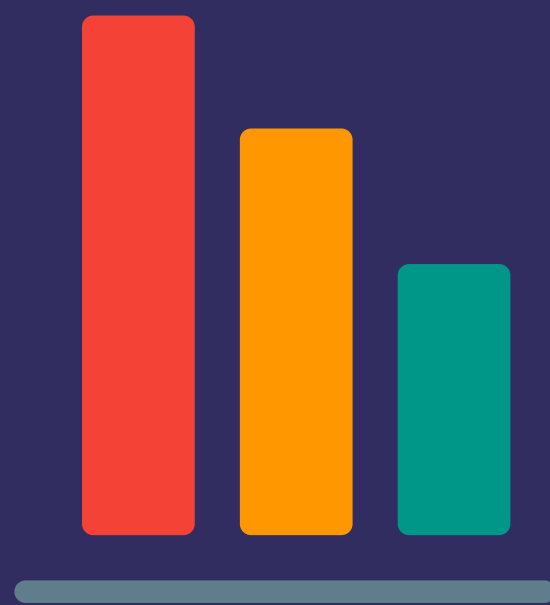
INDICADORES DE DESEMPENHO

A estratégia do CNJ é desdobrada em indicadores de desempenho, metas e projetos institucionais. Após a instituição do Planejamento Estratégico 2021-2026, portaria CNJ 104/2020, foram definidos os indicadores de desempenho e as metas que serão executados pelas unidades do CNJ a fim de que se cumpram os Objetivos Estratégicos.